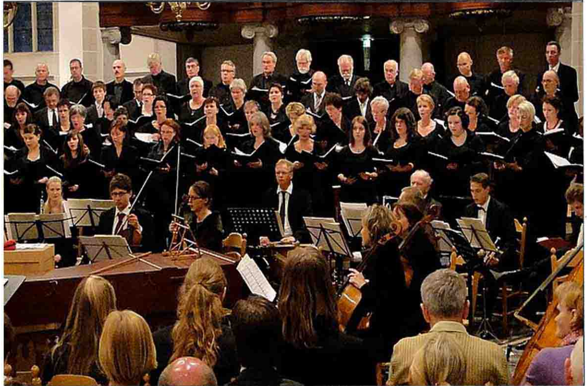
Een historisch moment. Zaterdagavond trad in de Grote Kerk van Steenwijk het Duitse Kammerchor Dillenburg gezamenlijk op met Cantica Sacra uit Steenwijk.

Haar ingrediënten waren om van te smullen: hapklare stukken van populaire klassieke componisten die bij een breed publiek lekker in het gehoor liggen. Veel werk van Händel, Bach, Mozart, maar ook de beroemde Eurovisie-tune. Laagdrempelig en toegankelijk voor